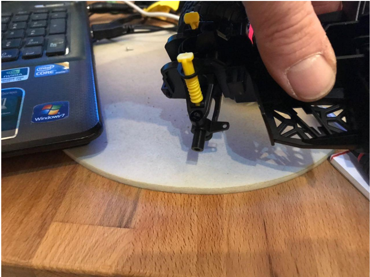
Beide Seitenteile miteinander verkleben. Sekundenkleber. Zuvor aber genau anpassen!